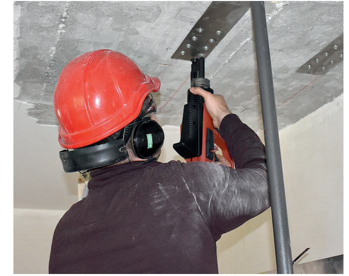
4 mechanisch endverankern mit Hilti Bolzensetzgerät und systemgeprüften, rostfreien Bolzen (X-CR 48 P8 S15)