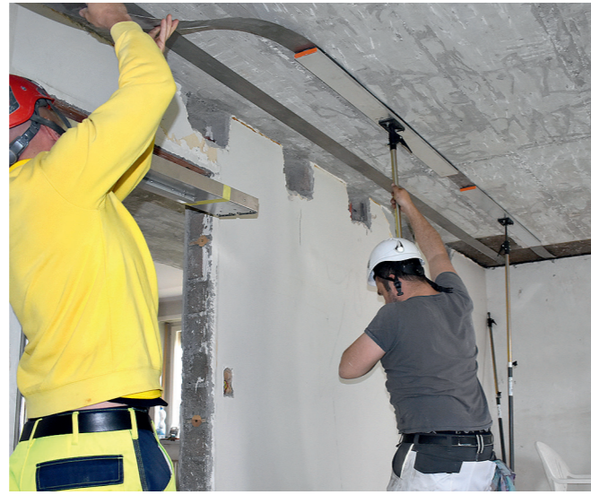
2 re-plate provisorisch mit T-Stützen fixieren