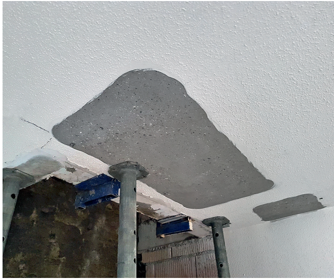
1 im Bereich der Verstärkung allfällige Beschichtungen und/oder Dämmungen entfernen