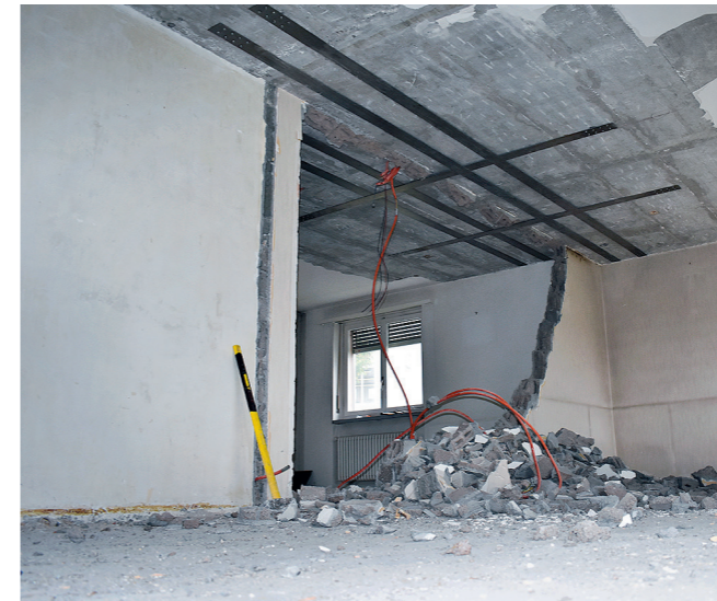
7 re-plate fertig appliziert und vorgespannt – tragende Bauteile können jetzt entfernt werden – falls erforderlich, systemgeprüftes Sika Brandschutzsystem applizieren