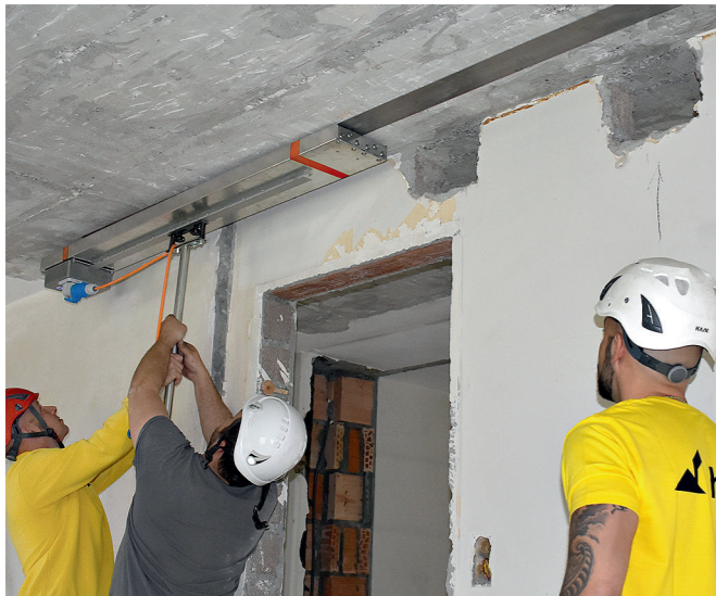
5 etappenweise Erwärmung mit re-IR 3000 Infrarot-Heizstrahler