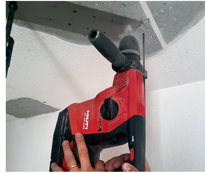
3 Traggrund durch vorgelochte re-plate vorbohren Ø 3.5 mm