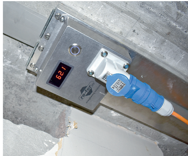
6 Temperaturkontrolle beim Erhitzen über das eingebaute Steuergerät Protokoll erstellen