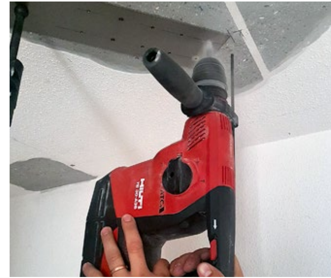
3 Forer au préalable le support au travers des re-plate préalablement forées Ø 3.5 mm