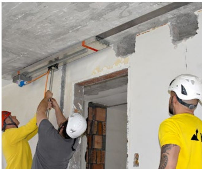
5 Chauffage par étape au moyen de l'appareil infrarouge re-IR 3000