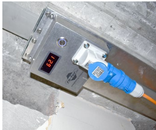
6 Contrôle de la température lors du chauffage par le biais de l'appareil de commande intégré