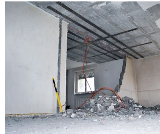
7 Application et précontrainte terminée de re-plate – les éléments de construction porteurs peuvent maintenant être enlevés – au besoin, appliquer le système de protection ignifuge Sika testé pour le système