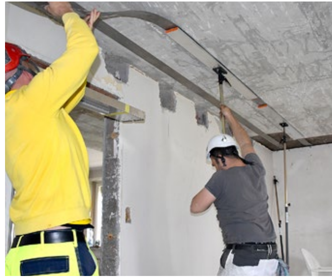
2 Fixation re-plate de manière provisoire avec des étais en T