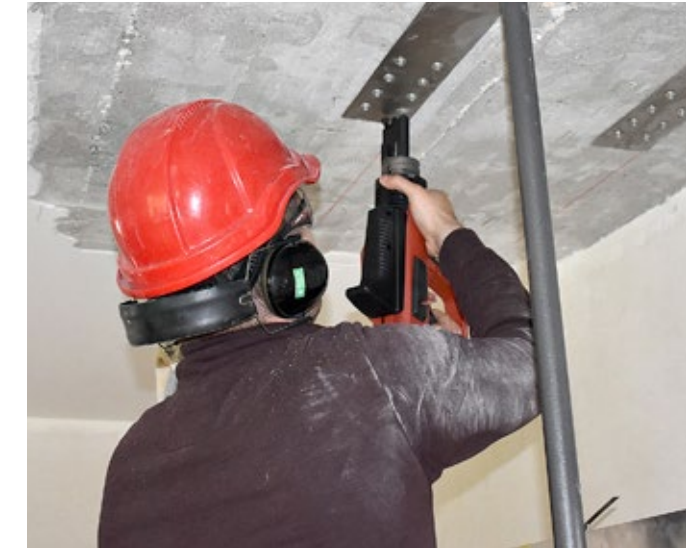
4 Ancrer mécaniquement les extrémités au moyen d'un fixateur de boulons Hilti et de boulons inoxydables testés pour le système (X-CR 48 P8 S15)