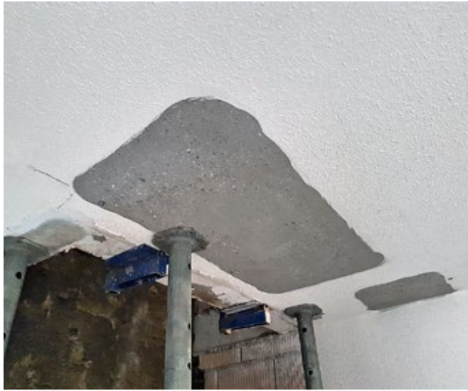
1 Dans la zone du renforcement, enlèvement d'éventuels revêtements et/ou isolation