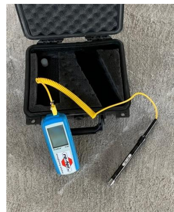
Temperatursensor mit Kontaktstift